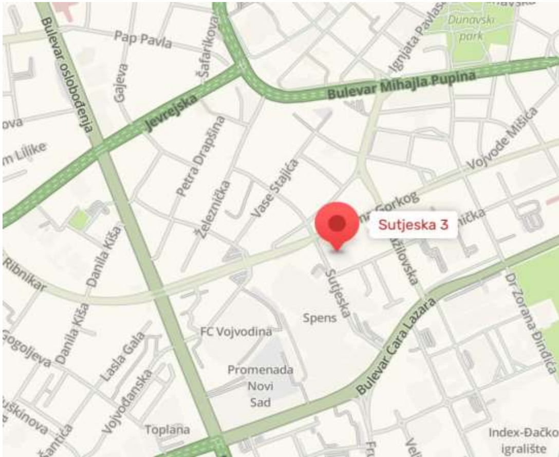
ВИШИ СУД У НОВОМ САДУ, Сутјеска 3, 21101 Нови Сад